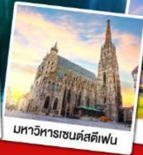
มหาวิหารเซนต์สตีเฟ่น