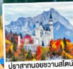
ปราสาทน้อยชวานส์ไตน์

09-15, 12-18 เม.ย. 69 26 เม.ย.-02 พ.ค. 69 29 เม.ย.-05 พ.ค. / 30 เม.ย.-06 พ.ค. 69 02-08 พ.ค. / 24-30 มิ.ย. 69 02-08, 16-22 ก.ย. 69