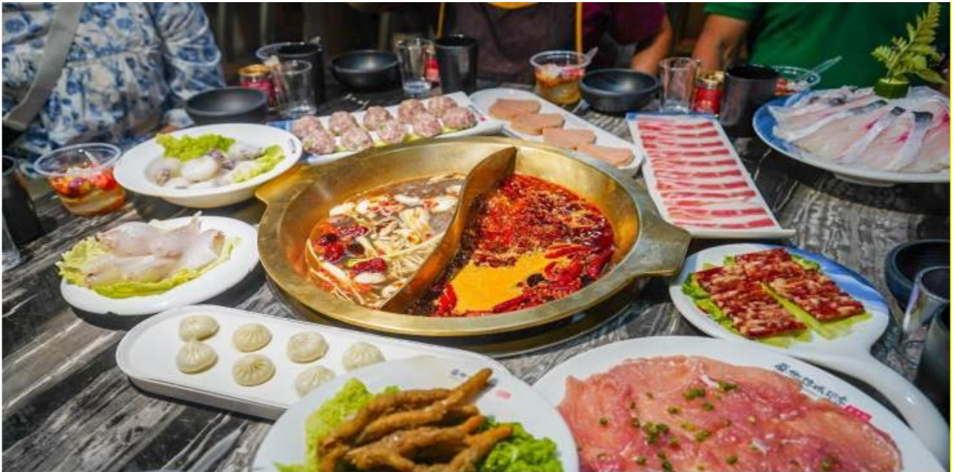
คำ รับประทานอาหารคำ ...อิสระตามอัธยาศัย ที่พัก Rightway Xiyue Hotel (มาตรฐานจีน)

วันที่ 5 เฉิงตู – ร้านหมอนโอโซน – วัดต้าฉือ – ถนนคนเดินชุนซีลู่ – หมีแพนด้าปีติ๊กIFS – ร้านPOP MART – ถนนไท่กุ่ทลี่ – สนามบินเฉิงตู (VZ3681 : 23.00 - 01.15+1) กรุงเทพฯ (สนามบินสุวรรณภูมิ)