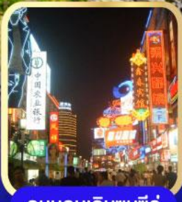
ถนนคนเดินซุนซีลู่