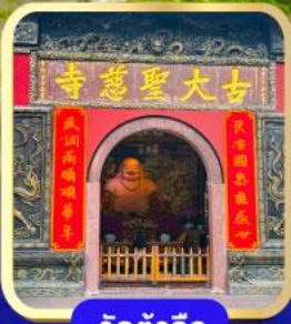
วัดต้าฉี