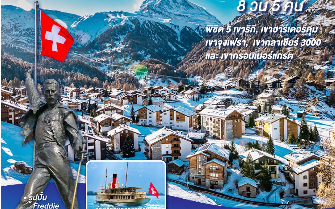
• รูปปั้น Freddie Mercury

พีช 5 เวก์, เวก์อาร์เคอร์คุม เวก์องเฟรา, เวก์ลาซีร์ 3000 และ เวก์รอนท์นอร์เกรท