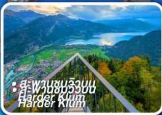
• สู่พานชมวิวก่อน Harder Kulm