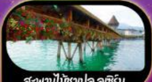
สะพานไม้ชาเปล คุชีรีน