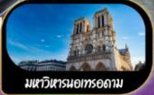
มหาวิหารนอทรอดาม