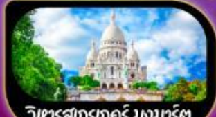
วิหารสกรเกอร์ มงมาร์ต