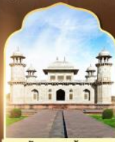
กิชมาฮาลน้อย