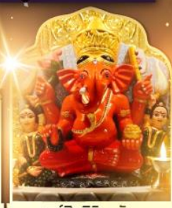
องค์สิทธินายก