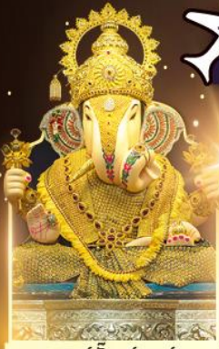
องค์ดึกขูที่พิเศษผู้