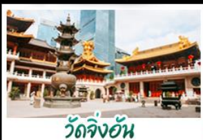
วัดจิ้งอัน