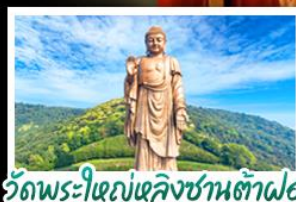
วัดพระใหญ่เฉิงชานต้าฝอ