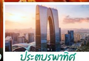
ประตูบูรพาทิศ