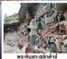
พระหินแกะสลักต้าจู๋