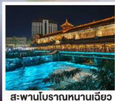
สะพานโบราณหนานเฉียว