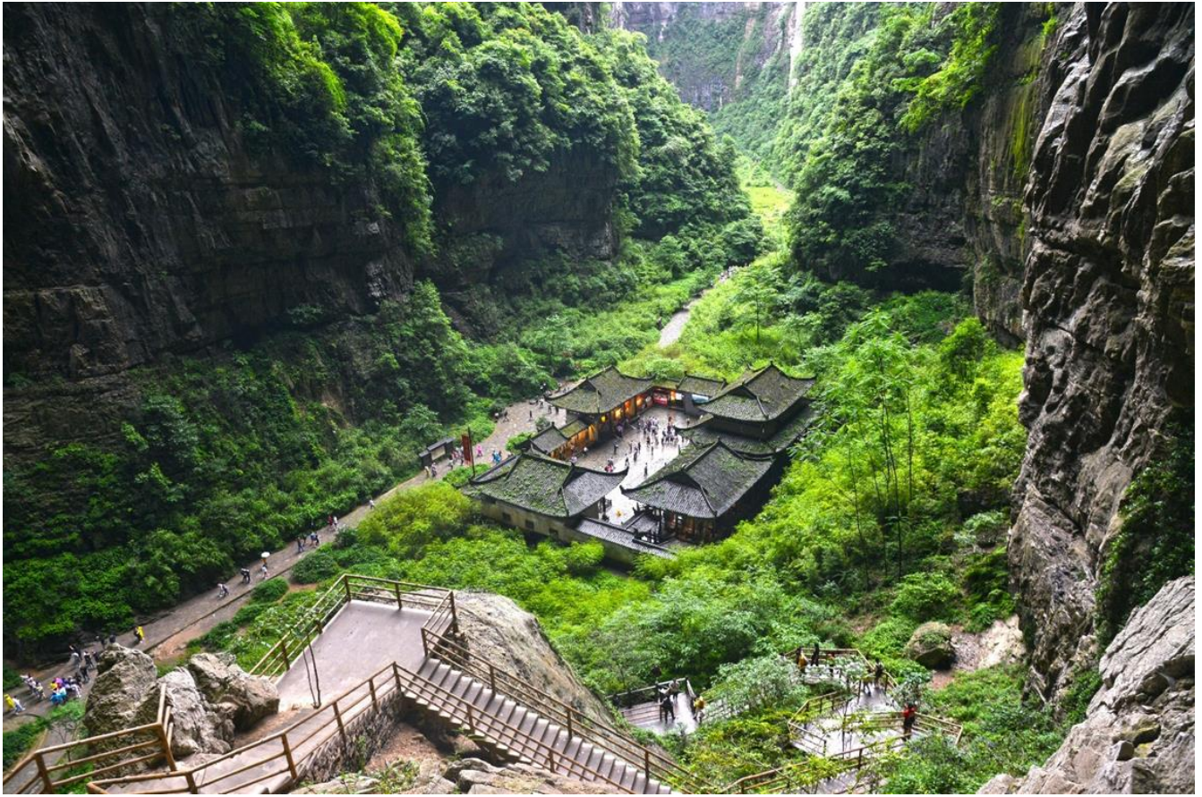
กลางวัน รับประทานอาหารกลางวัน ณ ภัตตาคาร (มื้อที่ 5)