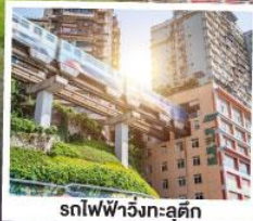
รถไฟฟ้าวงทะลุคิก