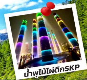
น้ำพุไม้ไฟตึกSKP