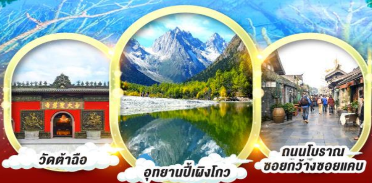
วัดคำจ้อ