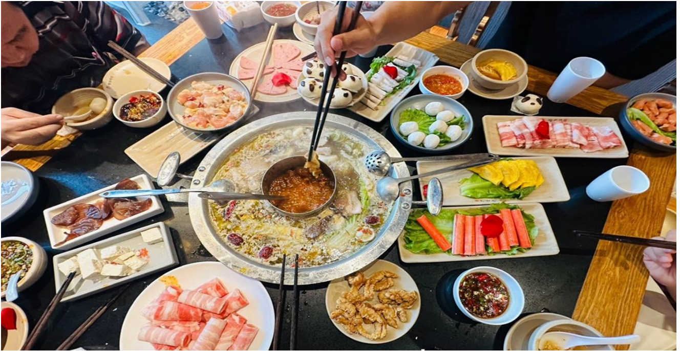
คำ รับประทานอาหารคำ ณ ภัตตาคาร (มือที่ 12) *เมนูพิเศษสุกี้หม่าล่าเสฉวน