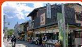
ช้อปปิ้งถนนสายชาเขียว