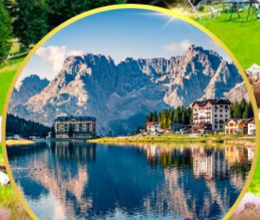
ทะเลสาบมิสุร์น่า