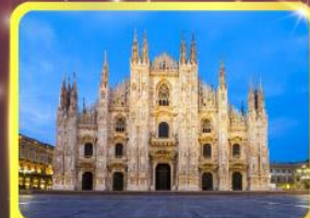
มหาวิหารแห่งเมืองมิลาน