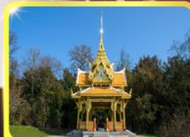
ศาลาไทยโซซานน์