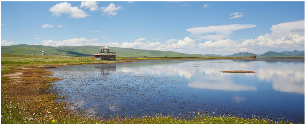
กลางวัน รับประทานอาหารกลางวัน ณ ภัตตาคาร (เมื่อที่ 17)

ขจี อากาศที่นี้บริสุทธิ์และบางเบา มีเพียงเสียงลมที่พัดผ่านยอดหญ้าและเสียงนกน้ำที่ขับขานเป็นท่วงทำนองแห่งธรรมชาติ บรรยากาศอันเงียบสงบจะชะล้างความเหนื่อยล้าให้หมดสิ้นไปในทันที ทะเลสาบแห่งนี้ไม่ได้เป็นเพียงความงดงามทางสายตา แต่ยังเป็นพื้นที่ชุ่มน้ำอันอุดมสมบูรณ์และมีความสำคัญยิ่งต่อระบบนิเวศบนที่ราบสูงทิเบต ถือเป็นแหล่งพักพิงและสวรรค์ของเหล่ากอพยพนานาชนิด โดยเฉพาะอย่างยิ่ง "นกกระเรียนคอดำ" สัตว์ปีกสง่างามอันเป็นสัญลักษณ์แห่งความสุขและอายุยืนยาวในวัฒนธรรมทิเบต ในช่วงฤดูร้อน ทุ่งหญ้ารอบทะเลสาบจะผลิดอกไม้ป่านานาพรรณ กลายเป็นภาพวาดสีสดใสที่ธรรมชาติรังสรรค์ขึ้น เชิญท่านทอดน่องไปตามสะพานไม้ที่ทอดยาวเหนือผืนน้ำ สูดอากาศอันแสนสดชื่นให้เต็มปอด พร้อมเก็บภาพความประทับใจของผืนน้ำจรดขอบฟ้า ที่ซึ่งฝูงปศุสัตว์ของชาวทิเบตพื้นเมืองกำลังเล็มหญ้าอย่างอิสระอยู่ไกลๆ