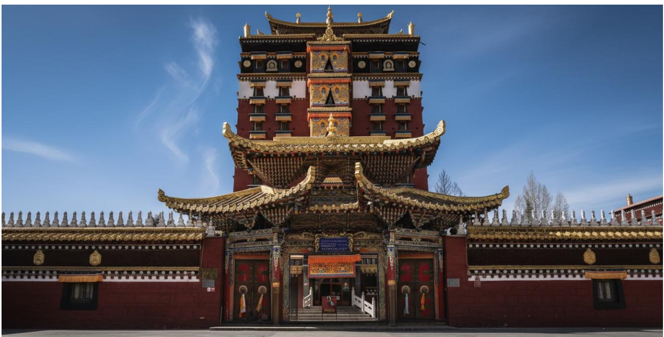
บ่าย นำท่านเดินทางสู่ หอพระมิลारेปะ (ระยะทาง 134 ก.ม. ใช้เวลาเดินทางประมาณ 2 ชั่วโมง) สู่ใจกลางศรัทธา หอพระ 9 ชั้น มิลारेปะ สถาปัตยกรรมทางพุทธศาสนาที่น่าอัศจรรย์ใจและเป็นหนึ่งเดียวใน