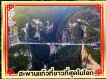
สะพานแกว่งที่ยาวที่สุดในโลก

เขาวงกต เทียนเหมินซาน สองเมืองโบราณ ฟูหลงเจิ้น เฟิ่งหวง