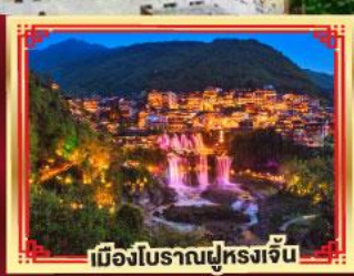
เมืองโบราณฟูหลงเจิ้น