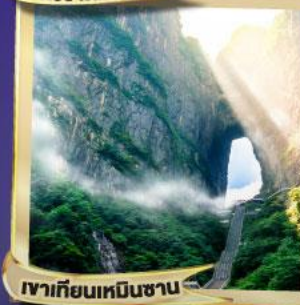
เขาเทียนเหมินซาน