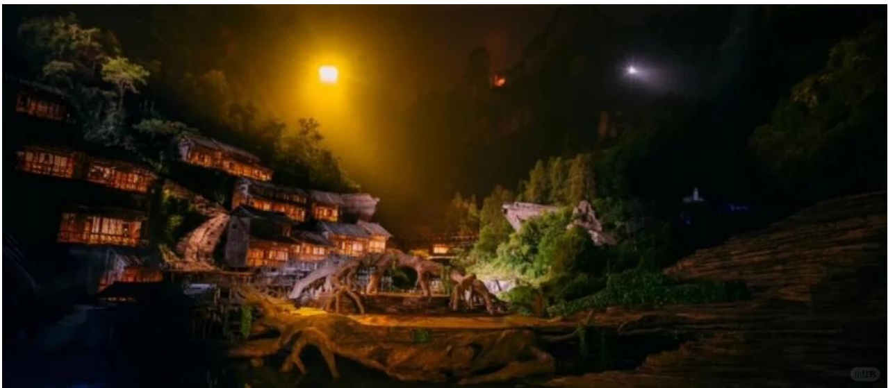
ที่พัก COUNTRY GARDEN PHOENIX HOTELหรือเทียบเท่าระดับ 5 ดาว (มาตรฐานประเทศจีน)

หมายเหตุ หากวันเดินทางดังกล่าวทางโซ่วงดการแสดง ทางบริษัทขอสงวนสิทธิ์เปลี่ยนเป็นโซ่วเสน่ห์เซียงซีแทนหรือโซ่วตำนานรักพันปี โดยไม่ต้องแจ้งให้ทราบล่วงหน้าและไม่มีการคืนค่าใช้จ่ายใดๆทั้งสิ้น