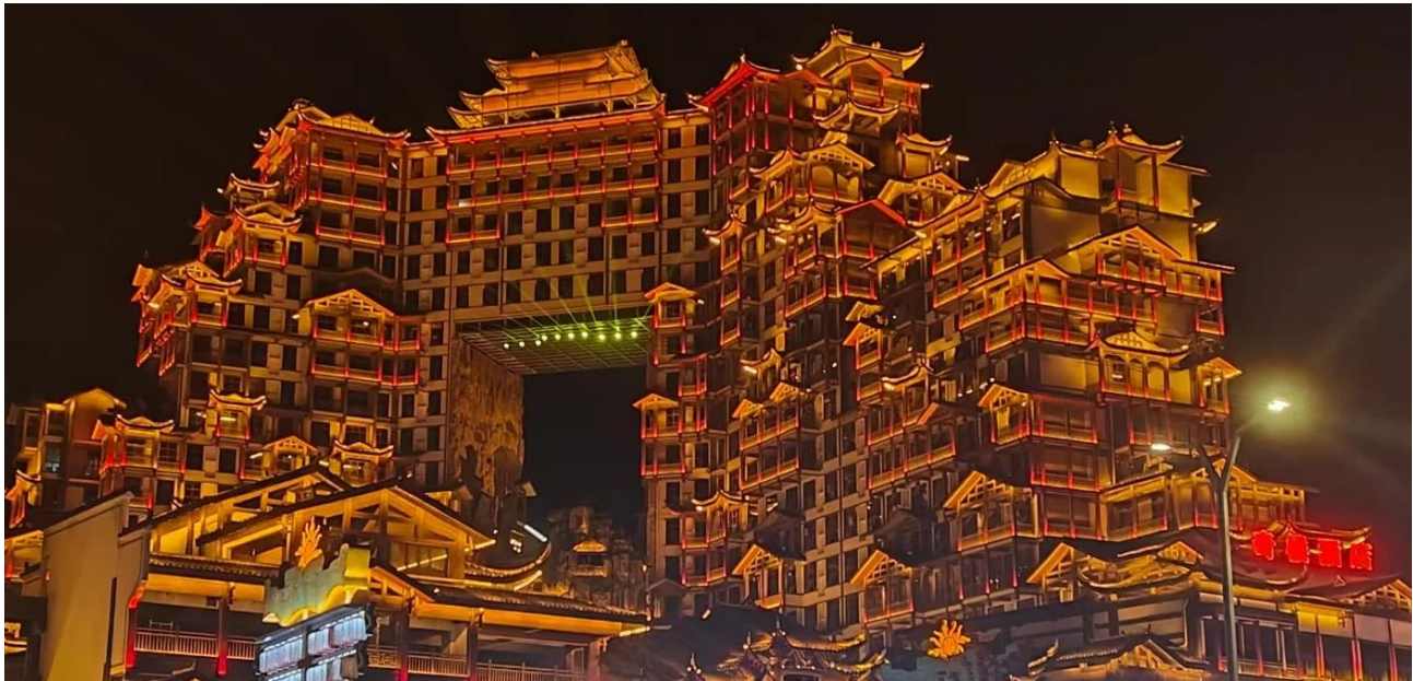
ที่พัก COUNTRY GARDEN PHOENIX HOTELหรือเทียบเท่าระดับ 5 ดาว (มาตรฐานประเทศจีน)

วันที่สอง บ้านเจ้าเมืองถู่เจีย – เขาเทียนเหมินซาน (รวมกระเช้าขึ้นลง) – ระเบิดงิ้วแก้ว (รวมผ้าห่มรองเท้า) - บันไดเลื่อน 99 ชั้น - ถ้ำประตูสวรรค์ – โข่วจิ้งจอกขาว